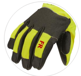
Výztuha mezi palcem a ukazováčkem