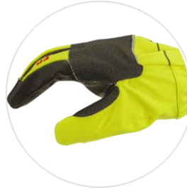
Vynikající úchop a citlivost