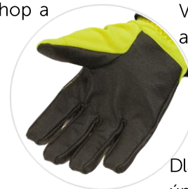
Dlaň z elastického úpletu odolná vůči protiprořezu